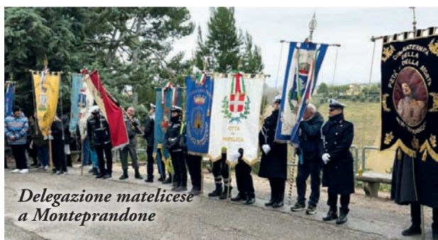
Delegazione matelicese a Montepandone

In onore di questo santo, da sempre tanto amato e legato alla città, al di là