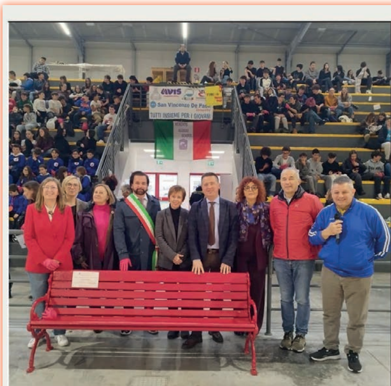
Una giornata al Palasport nella Giornata Internazionale contro la violenza sulle donne

Un grazie sincero va a tutte le scuole, insegnanti, volontari, associazioni e collaboratori che hanno reso possibile questo evento. Cerreto oggi ha lanciato un messaggio potente: 'insieme possiamo cambiare le cose'. E lo ha fatto con il cuore, l'impegno e la bellezza di una comunità che non dimentica e che sceglie di educare al rispetto".