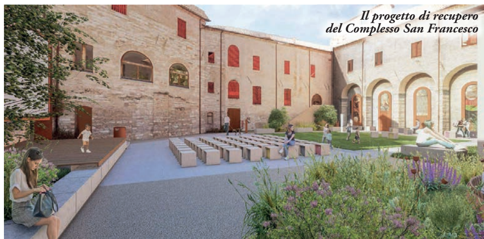
Il progetto di recupero del Complesso San Francesco