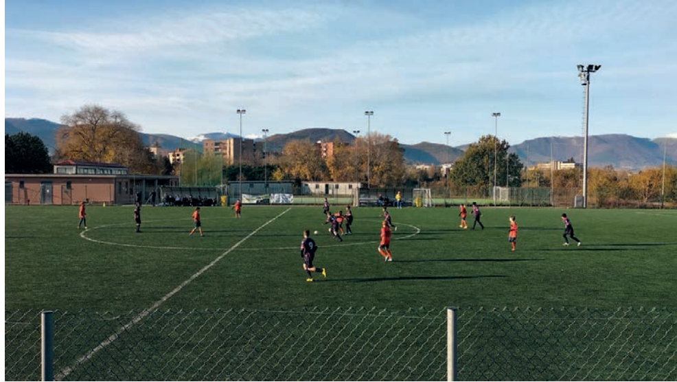
Una partita di calcio categoria Esordienti all'Antistadio (foto di repertorio)

Il Campo Sportivo "Vecchio", lo storico im-